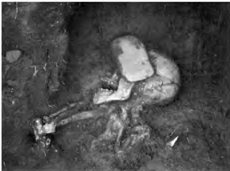
Fig.3- Enterramento com lâmina de machado.